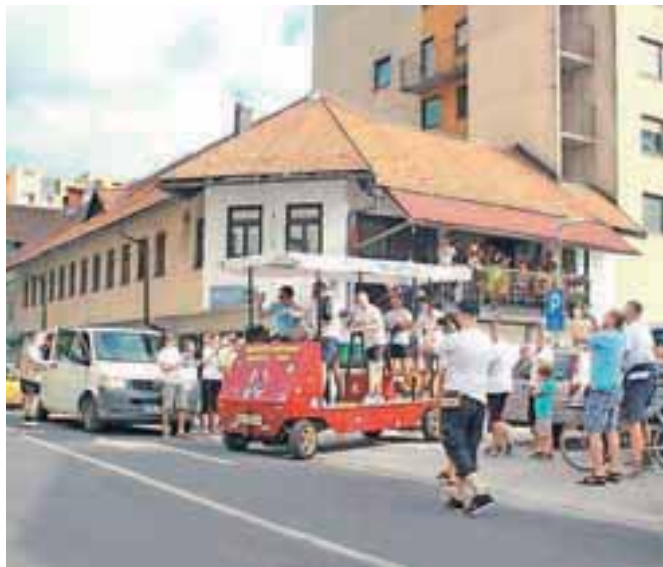
Maxovci z drezino na poti proti Pinei pri Novigradu

Po pol leta trdega dela pri izdelavi cestne drezine se je skupina tridesetih Jeseničanov – maksovcev v sredo, šestega avgusta, odpravila na dobrih 240 kilometrov dolgo pot do letovišča Zveze društev prijateljev mladine Jesenice Pinea v Novigradu. Vozni park maksovcev se je tako po skiroju, kolesih, na katerih so igrali človek ne jezi se, teku, rikši in mobilnem šanku razširil še z drezino, ki je sicer bolj poznana kot vozilo, namenjeno vožnji po železniških tirih. Ker so pričakovali, da bo letošnja pot v Pineo med napornejšimi, so se temu primerno tudi pripravili, tako so drezino poganjale tri ekipe, ki so se menjale pri človeškem pogonu skoraj več kot 800-kilogramske drezine. Osnova drezine je temeljila na kosih podvozja odsluženega Renaultovega twinga, trdem delu in bujni domišljiji. Zakaj je drezina namenjena vožnji po tirih, je maksovcem postalo jasno že med testnimi vožnjami, ko so na cesti dosegali bliskovitih pet kilometrov na uro, kljub štirim pogonalcem na ročnem mehanizmu in dodatnem na pedalih. Tri posadke, sestavljene iz šestih članov, so se na drezini med vožnjo menjala na vsakih 15 minut, kljub fizičnemu naporu pa so se ekipam pridružila tudi dekleta. Drezi-