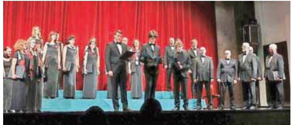
Odličen zbor Vox Carniola