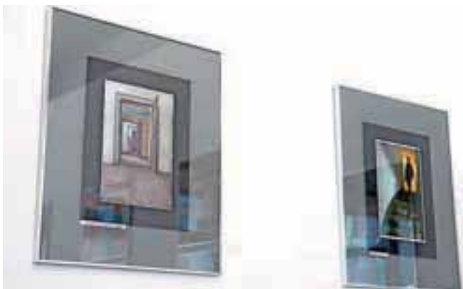
Na ogled so nagrajene in izbrane fotografije članov društva.