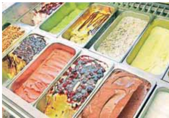
Čokolada, vanilija, jagoda, jogurt, pri otrocih piškotek in nutela – to je »zlata« šesterica najbolj priljubljenih okusov.