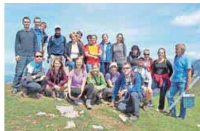
Udeleženci tabora na vrhu Golice

planine, kjer se je molzla živina, imeni, kot sta Stara frata in Sekane pričata o izsekovanju gozdov,« je povedal Klemen Klinar. Del tabora je bil namenjen tudi terenskemu