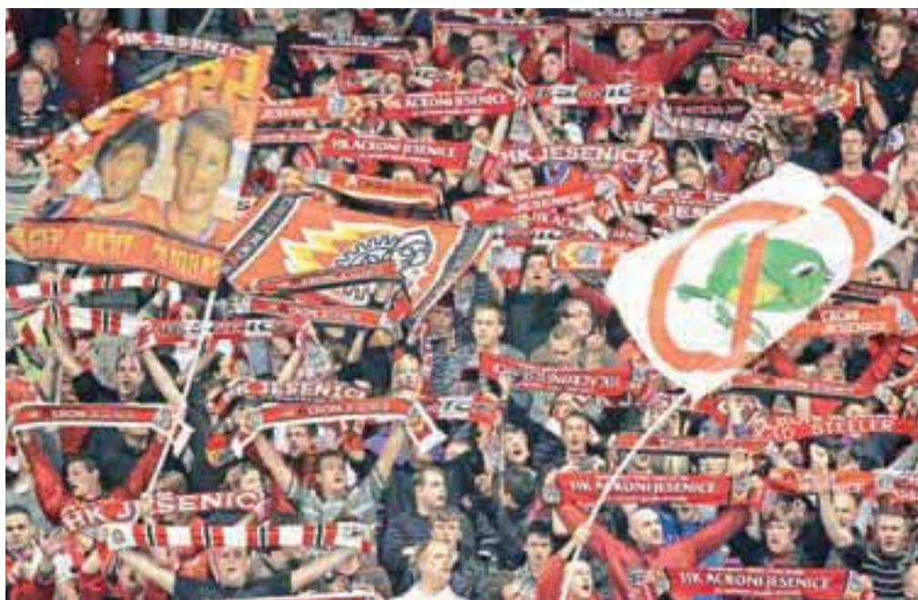
Bo v Podmežakli spet pravo navijaško vzdušje?