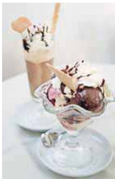
Sladni sladoledni posladki