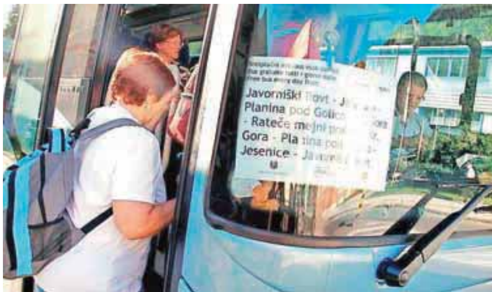
Avtobus je okolju prijazen, ustavlja na večini postajališč v jeseniški in kranjskogorski občini. Na njem je v treh jezikih označeno, da je brezplačen.

Vsako jutro ob 7.50 s Pristave v Javorniškem Rovtu na pot krene posebni brezplačni avtobus, ki – potem ko ustavi na vseh postajališčih v jeseniški in kranjskogorski občini – ob 9.20 pripelje na mejni prehod Rateče. Potniki nato lahko peš prestopijo nekdanjo mejo, na italijanski strani pa jih (vsak dan, razen nedelje) že čaka drug, italijanski avtobus, ki jih prav tako brezplačno odpelje do Trbiža. Slovenski avtobus se z mejnega prehoda zatem vrne proti Javornišskemu Rovtu in znova omogoča brezplačen prevoz potnikom po kranjskogorski in jeseniški občini. Podobno je popoldne, ko avtobus s Pristave odpelje ob 16. uri in se z mejnega prehoda vrača ob 17.40 (ko se z njim lahko domov odpeljejo potniki, ki so se zjutraj podali v Trbiž). Kot je povedala Aleksandra Orel z Občine Jesenice, so brezplačni avtobus uvedli v sklopu projekta IDAGO, ki naj bi izboljšal dostopnost in atraktivnost gorskih obmejnih območij, v pretežni meri pa je financiran iz evropskega denarja v okviru programa čezmejnega sodelovanja Slovenija–Italija 2007–2013) in nacionalnih