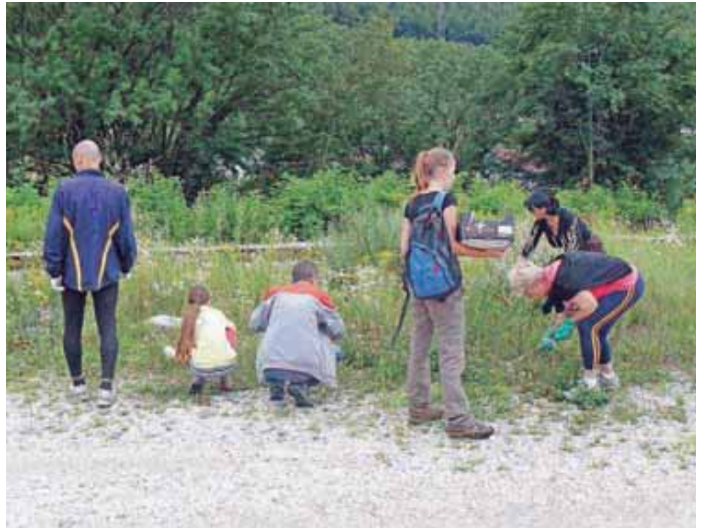
V jeseniški občini so potekale štiri akcije odstranjevanja invazivk, ki so jih izvedli na različnih lokacijah.