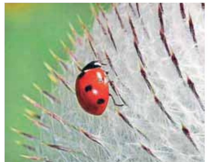
Pikapolonica med bodicami