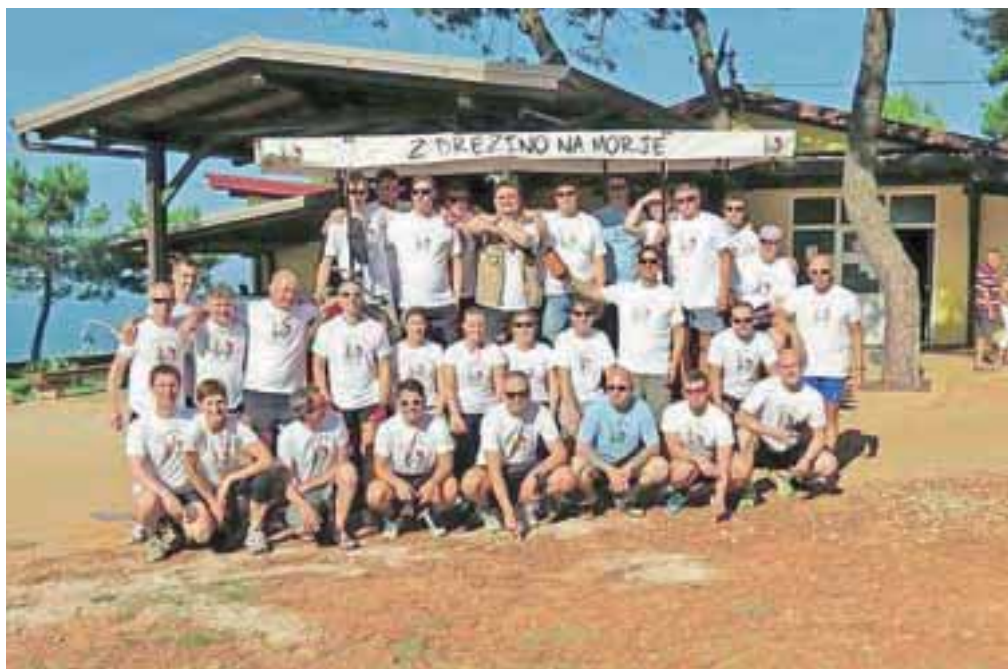
Ekipe maksovcev po »drezinanju« do letovišča Pinea

na je za vsak primer opremljena tudi s priključkom za vleko, tako so jo v daljše in strmejšje klanke lahko tudi povlekli s kombijem, večinom pa je šlo za veliko porivanja v hrib s strani posadk, med vožnjo pa ni manjkalo takšnih in drugačnih zabavnih vložkov, od napada koruze do zasede. Na cilj v letovišče Pinea pri Novigradu so prispeli v petek, 8. avgusta, dopoldne in tako v Pineo simbolično dostavili 3600 evrov, ki so jih spomladi zbrali s humanitarnim tekom Jesenice tečejo, denar pa je bil namenjen letovanju petnajstih otrok iz socialno šibkejših družin.