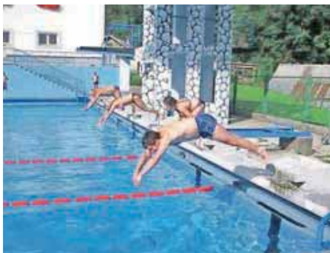
Plavalnega maratona se je udeležilo 65 plavalcev vseh starosti.

zni športniki, s svojimi člani pa so bile zelo aktivne skupine tekaške sekcije Jesenic, curling kluba, košarkarskega kluba in ekipa Kozli99. Na turnirju v vaterpolu, ki je potekal na predvečer mara-