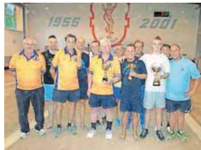
Najboljše ekipe na balinarskem turnirju v Bazi